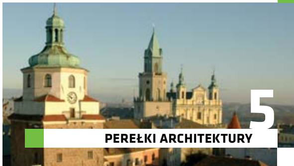
Brama Krakowska, Wieża Trynitaraska, Archikatedra Lubelska

BAZYLIKA OO. DOMINIKANÓW jest jednym z najcenniejszych obiektów sakralnych w Polsce. Kościół i klasztor ufundował w 1342 r. król Kazimierz Wielki. W murach kościoła w 1569 r., po podpisaniu Unii Lubelskiej, odprawiono nabożeństwo dziękczynne, w którym uczestniczył król Zygmunt August. Świątynia już wtedy cieszyła się międzynarodową sławą jako skarbnica relikwii Krzyża Świętego, jednych z największych na świecie. Zespół sakralny dominikanów w Lublinie jest zabytkiem, któremu przyznano Znak Dziedzictwa Europejskiego.