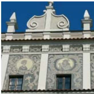
Fragment kamienicy Chociszewskich