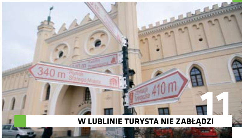
Drogowskazy turystyczne przed Zamkiem Lubelskim

Lublin proponuje turystom tematyczne zwiedzanie miasta dzięki sieci znakowanych szlaków turystycznych. Szlak Wielokulturowy wiedzie od Pomnika Unii Lubelskiej do wzgórza Czwartek. Szlak Zabytków Architektury ma swój początek w Bramie Krakowskiej i prowadzi przez Śródmieście