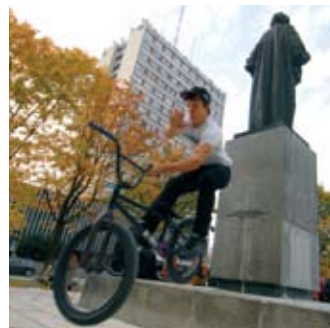
Miasteczko Akademickie, Plac Marii Curie-Skłodowskiej

Co piąty mieszkaniec Lublina to student. Młodzież akademicka kształci się w czterech uniwersytetach: Uniwersytecie Marii Curie-Skłodowskiej, Katolickim Uniwersytecie Lubelskim Jana Pawła II, oraz Przyrodniczym i Medycznym. Do grona większych uczelni należy też Politechnika Lubelska. W Lublinie działają również uczenie niepubliczne.